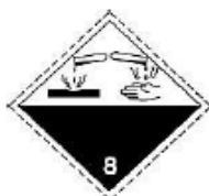
nr 8 Czarny nadruk na białym tle.