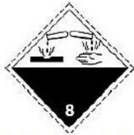
nr 8 Czarny nadruk na białym tle.